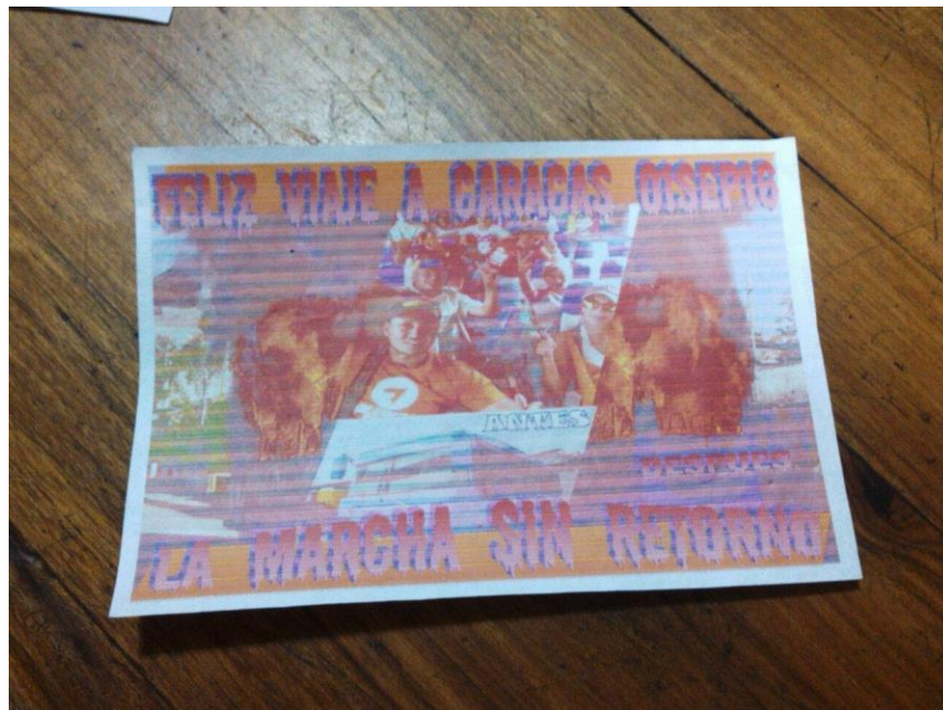
Panfleto lanzado frente a la Alcaldía de Valera, estado Trujillo