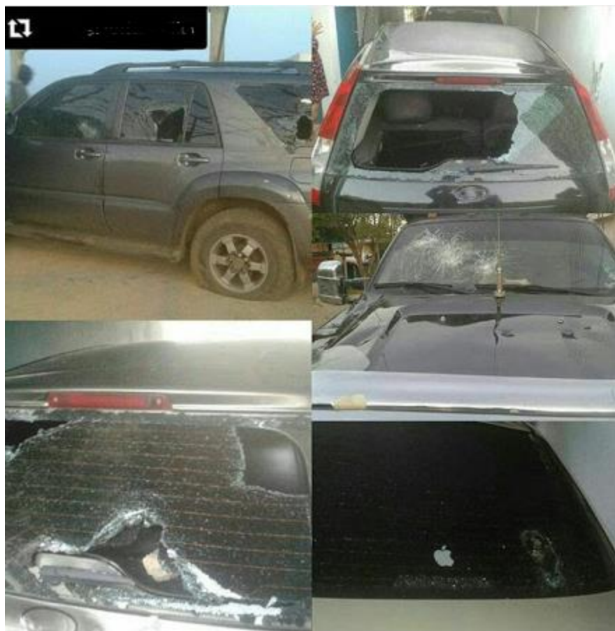
Fotografía de los vehículos destruidos

Diez chamos de Clarines que estaban caminando con otro grupo de diputados los pusieron presos y mañana [se refiere al 31 de agosto] los presentan al Ministerio Público. No se sabe el delito. Ese mismo grupo durmieron en Clarines anoche [29 de agosto] y se metieron en la casa donde estaban durmiendo y en el patio les acuchillaron los cauchos a los carros y les explotaron los vidrios con piedras.