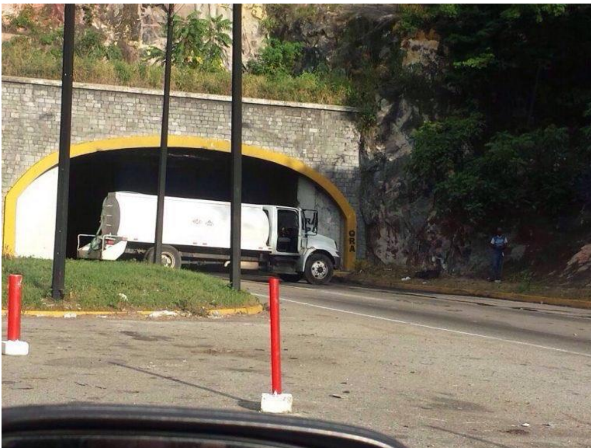
31 de agosto. Vehículo de carga pesada atravesado en la entrada del Túnel de La Cabrera, entre los estados Aragua y Carabobo, en sentido a Caracas. Tránsito interrumpido por varias horas.